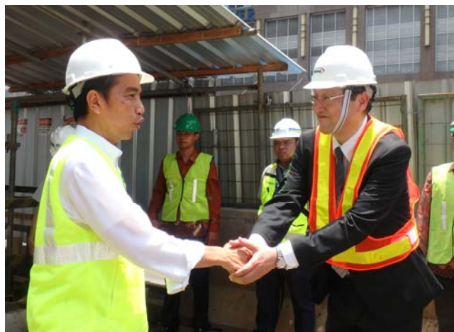
左：ジョコ・ウィドド大統領 右：米澤栄二 弊社代表取締役社長