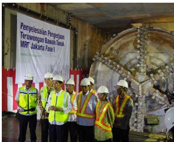
貫通したシールド 2 号機の前であいさつされるジョコ・ウィドド大統領（前列中央）